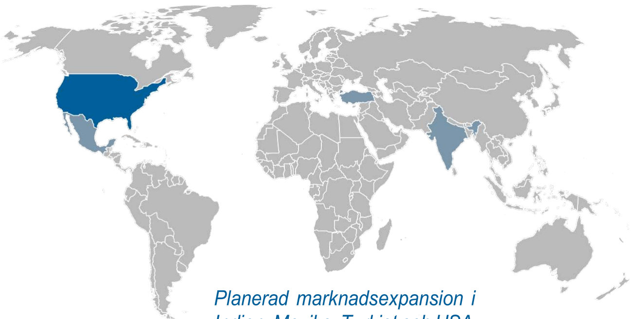
Planerad marknadsexpansion i Indien, Mexiko, Turkiet och USA

Sedan CE-märkningen av UBP 2020 har Glycorex inlett en pre-lansering som syftar till att generera kunskap om detta specifika segment i marknaden och långsiktigt bygga Glycorex till ett starkt varumärke även inom UBP-området. Ambitionen är att i samarbete med utvalda kunder i Europa och USA dokumentera det bästa sättet att tillvarata UBPs stora potential för att därefter optimera affärsmodellen och intensifiera försäljningsinsatserna.