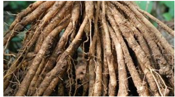
Aloe Vera, Shatavari