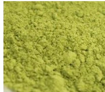
Chlorella, Echinacea, Matcha