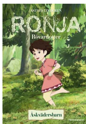
Seriealbum Ronja Rövardotter - Åskvädersbarn

Nästa seriealbum, Ronja Rövardotter – Vildvittrorna , släpps i mars 2017. Internationellt har TV-serien om Ronja rönt stort intresse och den kommer att sändas i USA och Storbritannien, har köpts in av bolag i bland annat Tyskland, Spanien, Belgien och Mellanöstern och förhandlingar pågår i Frankrike, Italien och Ryssland.