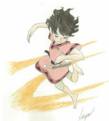
Illustration av Katsuya Kondo.

Den nytgivna boken har illustrerats av Katsuya Kondo, en av Studio Ghiblis nyckelanimatörer. Samarbetet inleddes med en tv-serie som gick på Sveriges Television under våren. Samtidigt med originalboken släpps också berättelsen i serieformat, Ronja Rövardotter – Åskvädersbarn , det första av fyra seriealbum.