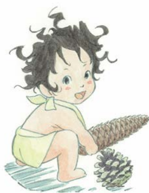
Liten Ronja. Illustration ur boken