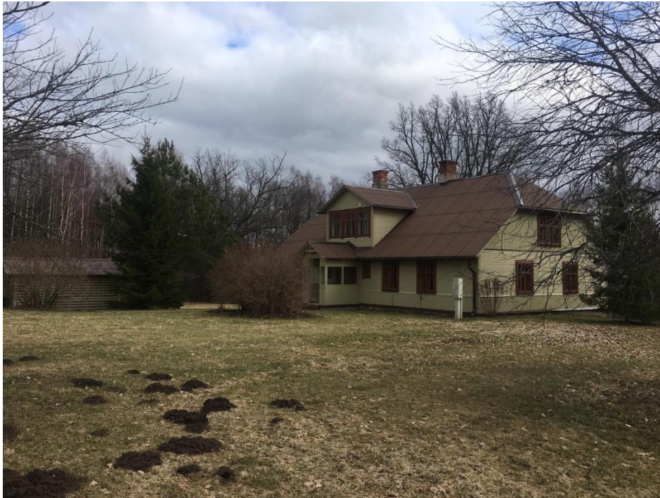
(Gården i Priekuli, nära Cesis)

Dessutom har bolaget styckat av en 2,3 hektar stor gård från en tidigare förvärvad fastighet. Gården såldes för 78 TEUR. Fastigheten som är på 65,5 hektar med 16 503 m 3 virkesförråd köptes för 250 TEUR i oktober 2019. Efter försäljningen har vi förvärvat för 10,41 EUR per kubikmeter av virkesbeståndet.