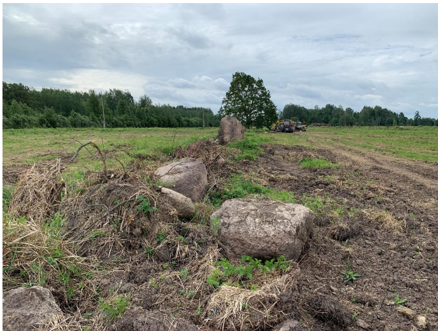
(Såld jordbruksmark i Nautrenu kommun, norr om Rezekne)

Latvian Forest Company AB:s (LFC) styrelse har godkänt försäljningen av 193,4 hektar jordbruksmark för 386,8 TEUR till ett lettiskt lantbruksföretag. LFC har beviljat köparen ett femtonårigt annuitetslån som skall ge en årlig avkastning motsvarande 9,41 %. LFC säkerställer fordran genom pant i de sålda fastigheter revers av sålda tillgångar. Köparen kommer att investera ca. 800 EUR per hektar i markförbättrande åtgärder.