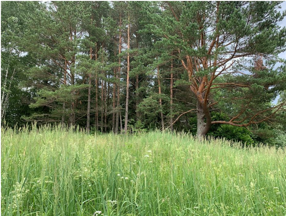
(Exempel på naturligt beskogad jordbruksmark i Cornaja kommun, nära Rezekne)

Av de 1 307 hektaren jordbruksmark, är 753 hektar brukat och uthyrt till lokala lantbrukare till en medelavkastningen av 70 EUR/hektar per år exklusive moms. Resterande består av naturligt beskogad mark som bolaget gradvis konverterar till skogsmark genom att konvertera jordbruksmark till skogsmark och genomföra tilläggsplanteringar av granbestånd. Det befintliga virkesförrådet på sådan mark enligt en konservativ uppfattning uppgår till 25 000 m 3 . Bolaget anser sig kunna konvertera 600 hektar jordbruks- och annan mark till skogsmark inom de närmaste två åren.