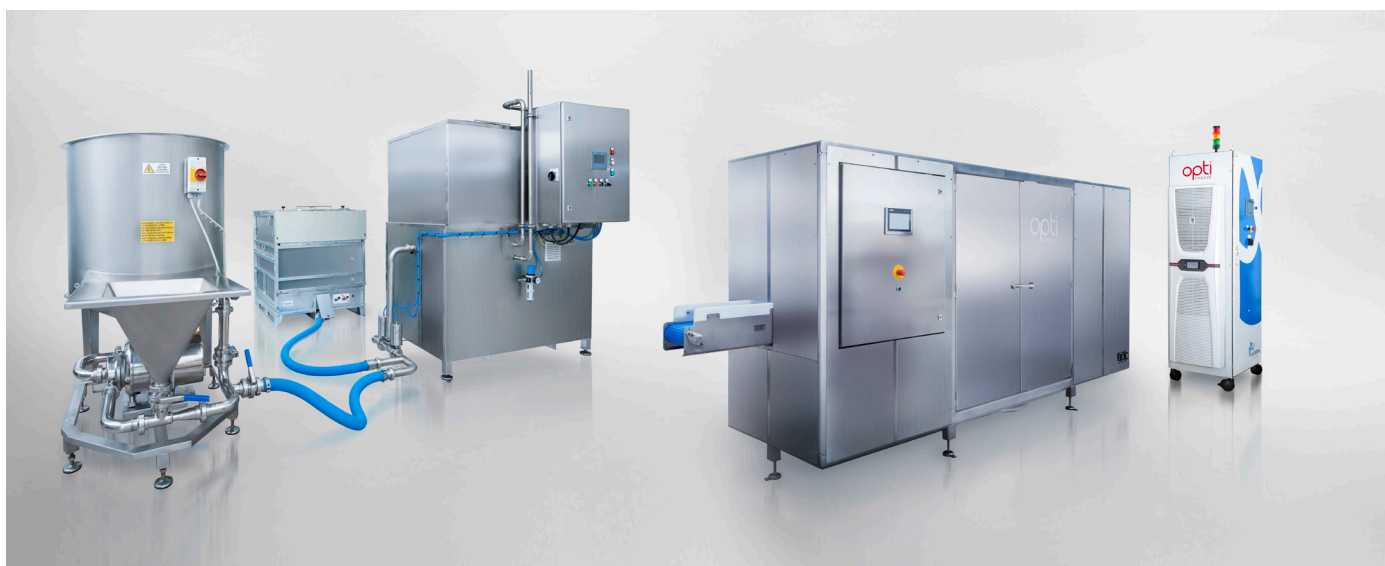
OptiCept™, vakuumimpregneringsmaskin (VI) och PEF-maskin (Pulsed Electric Field)

Bolaget grundades 2011 av LU Innovation, flertalet forskare på Department of Food Technology på Lunds Universitet och ArcAroma AB (publ).