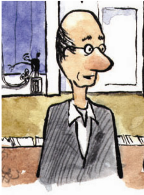
Starke Man (M)