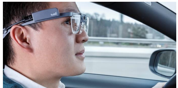
Tobii Pros eyetracking-glasögon erbjuder en unik möjlighet att studera beteende på ett objektivt sätt i många olika miljöer.