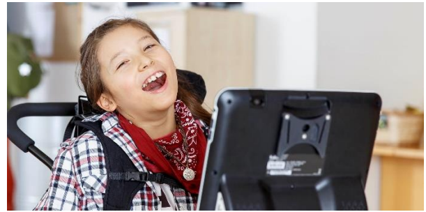
Tobii Dynavox ögonstyrda kommunikationsapparater ger personer med funktionshinder möjlighet att kommunicera och leva rikare liv.

Tobii har drygt 600 anställda och täcker världsmarknaden genom egna kontor i Sverige, USA, Kina, Japan, Norge, Tyskland, Storbritannien, Sydkorea och Taiwan samt genom ett globalt nätverk av återförsäljare. Tobii har sitt huvudkontor i Danderyd och är sedan april 2015 noterat på Nasdaq Stockholm.