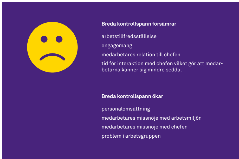
Figur 3. Schematisk uppställning över effekten av breda kontrollspann på medarbetares arbetssituation