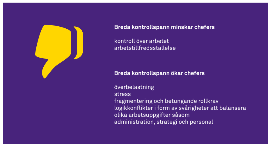
Figur 2. Schematisk uppställning över effekten av breda kontrollspann på chefers arbetssituation

betare än genomsnittet. Detta kan enligt forskarna bero på att en betungande arbetssituation för vissa chefer gör att de har mindre tid att interagera och ge återkoppling till sina chefskollegor. När det finns mindre tid att hjälpa åt och stödja varandra påverkar det hela arbetsgruppen negativt (Wallin m.fl. 2013). I figur 2 nedan sammanfattas resultaten av forskningen om kontrollspannets effekter på chefers arbetssituation.