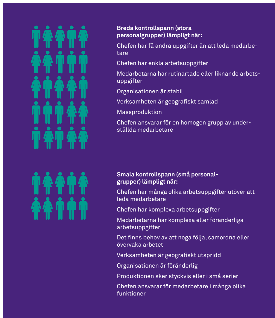
Figur 1. Schematisk uppställning över faktorer som påverkar kontrollspannets bredd

Sammanfattningsvis visar resultaten att lämplig bredd på kontrollspannet beror på komplexiteten och variationen i chefernas och medarbetarnas arbetsuppgifter samt vilken typ av produktion eller verksamhet organisationen ägnar sig åt. Smala kontrollspann är lämpliga när chefer och medarbetare har stora ansvarsområden och många olika arbetsuppgifter och när dessa är svåra att förutsäga eller påverka. Smala kontrollspann lämpar sig också när organisationen är föränderlig, när produktionen är komplicerad och det finns stort behov kunskapsöverföring och anpassning. I figuren nedan sammanfattas resultaten från den refererade forskningen om kontrollspann som presenteras i detta avsnitt och i det föregående avsnittet.