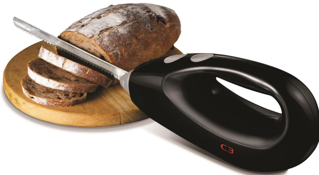
C3 30-10710 Elektrisk brödkniv