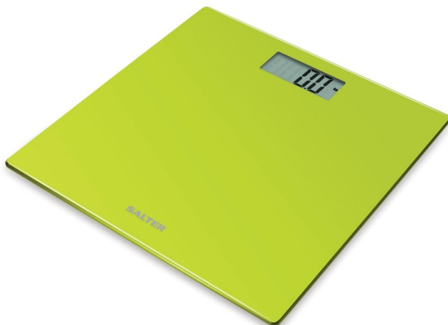
Salter 9069 GN3R Personvåg

Periodens kassaflöde från den löpande verksamheten före förändring av rörelsekapital var -15,9 mkr (-3,3). Förändring i rörelsekapital påverkade kassaflödet positivt med 6,7 mkr (57,4). Kassaflödet från investeringsverksamheten var -10,8 mkr (68,8) och utgörs främst av den utbetalning som gjordes till SodaStream efter den slutgiltiga överenskommelse. Kassaflödet från finansieringsverksamheten var 12,2 mkr (-104,1) främst beroende på upptagna ägarlån under perioden. Periodens kassaflöde uppgick till -7,8 mkr (18,7).