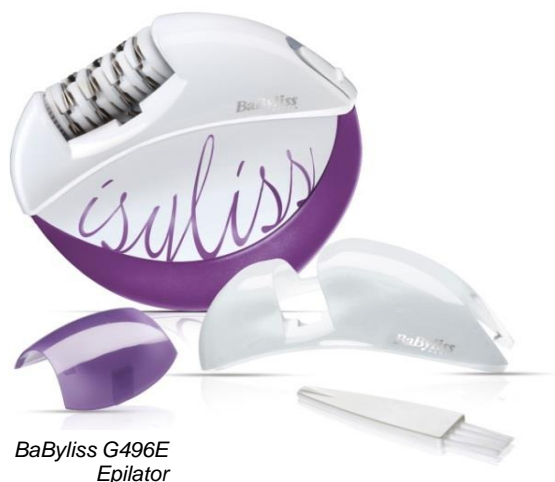
BaByliss G496E Epilator