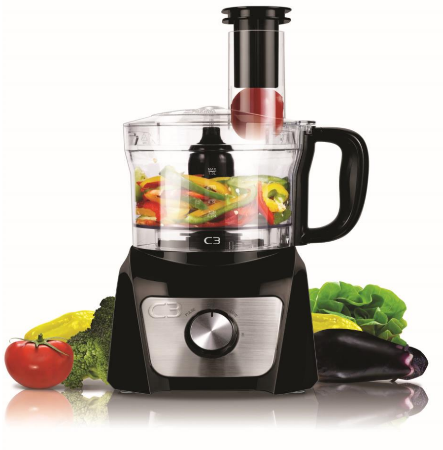
C3 30-10110 Matberedare