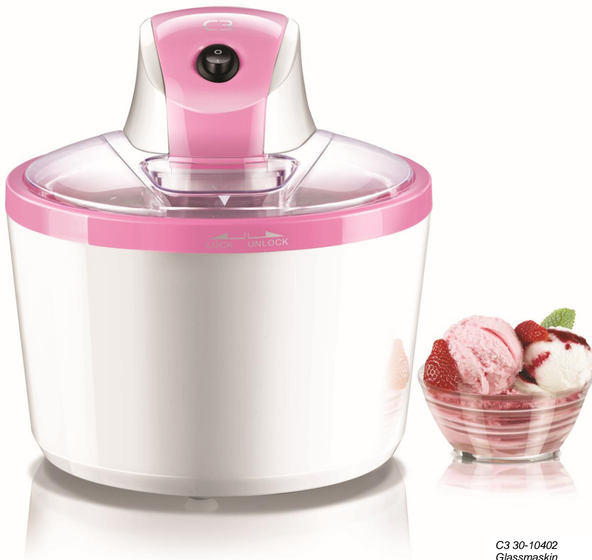
C3 30-10402 Glassmaskin

Periodens kassaflöde från den löpande verksamheten före förändring av rörelsekapital var -13,9 mkr (1,7). Kassaflödet från investeringsverksamheten var -9,8 mkr (68,8). Kassaflödet från finansieringsverksamheten var 5,6 mkr (-93,4). Periodens kassaflöde uppgick till -10,5 mkr (37,2).