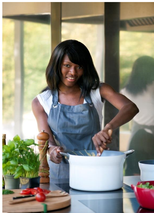
GP17003 GreenPan Dubai