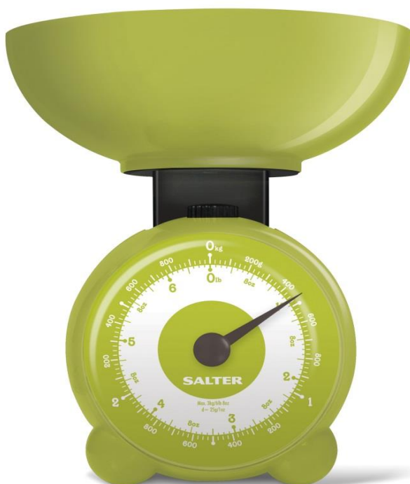
Salter 139GNDR Köksvåg