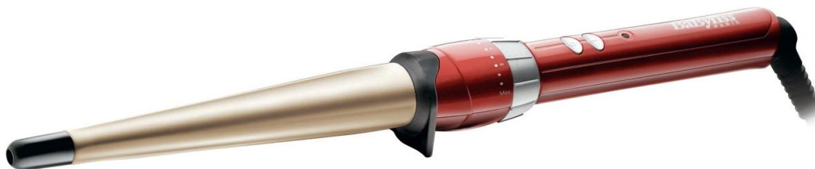
BaByliss C20E Curliron