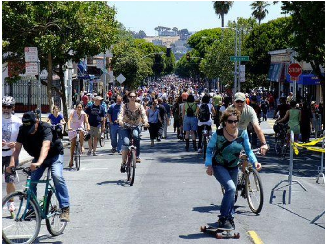
Sunday Streets SF, San Francisco