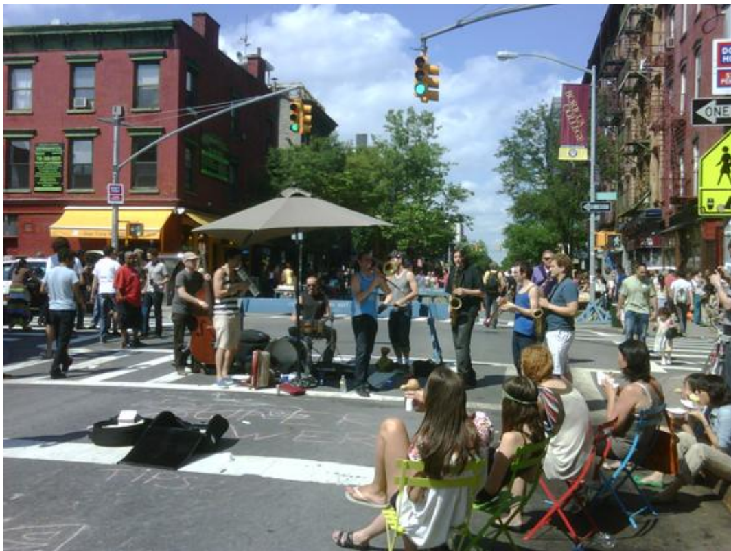
Summer Streets, New York City

Många källor vittnar om den känslomässiga effekt det hade i New York när borgmästare Michael Bloomberg chockade invånarna med att stänga av en del av Broadway som ingen trodde att de kunde klara sig utan. Inte nog med att det gav New York ett intressant och spännande tillskott i stadsmiljön, det fick människor att se på staden med nya ögon och börja tänka på lösningar och utvecklingsmöjligheter som tidigare verkat vara utom räckhåll. Ett "nytt" Times Square gav invånarna i en redan stolt stad en känsla av att de kan åstadkomma sådant andra bara drömmer om att göra.