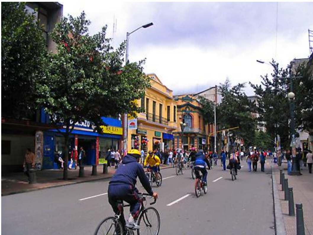
Ciclovía, Bogotá, Colombia

Genom att stänga av biltrafik på utvalda gator varje söndag har Bogotá skapat utrymme för hundratals frivilliggrupper att organisera konserter, dans, sportevenemang, cykling och andra fysiska aktiviteter samt temporära caféer, barer och restauranger vilka lockar tusentals människor att träna, umgås med familj och vänner och bejaka sin fritid på ett sätt de aldrig gjort tidigare.