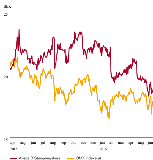
Aktiekursutveckling 1 januari 2015 – 30 juni 2016

Avega Group hade vid periodens utgång 2 256 aktieägare och börsvärdet uppgick till 211 MSEK. Den 30 juni 2015 uppgick betalkursen för Avega Groups aktie till 20,40 SEK. Sista betalkurs den 30 juni 2016 uppgick till 18,60 SEK.