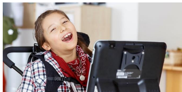
Tobii Dynavox ögonstyrda kommunikationsapparater ger personer med funktionshinder möjlighet att kommunicera och leva rikare liv.