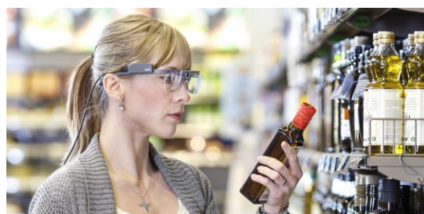
Tobii Pros eyetracking-glasögon erbjuder en unik möjlighet att studera beteende på ett objektivt sätt i många olika miljöer.