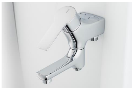
Mora Cera ettgreppsblandare för kök, dusch och bad lanserades i juni 2017.