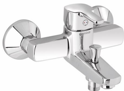
Damixa Pine kar- och duschblandare lanserades i april 2017.

Medelantalet anställda uppgår till 534 (553). Antalet visstidsanställda har minskat med 23 jämfört med föregående år.