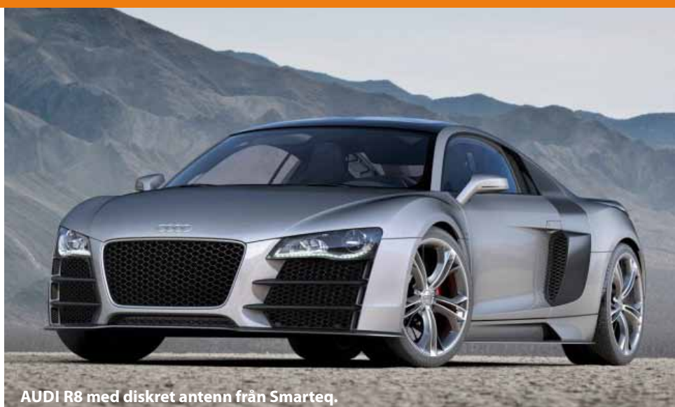
AUDI R8 med diskret antenn från Smarteq.