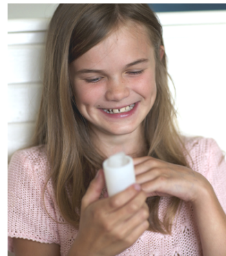
Maia med bulglass!

Tröstisar AB utvecklar produkter för barn som tröstar, skyddar och lindrar. Sedan lanseringen av Gosedjursplåster i september 2011 är företaget idag etablerat i åtta länder och har tolv olika produkter klara för försäljning.