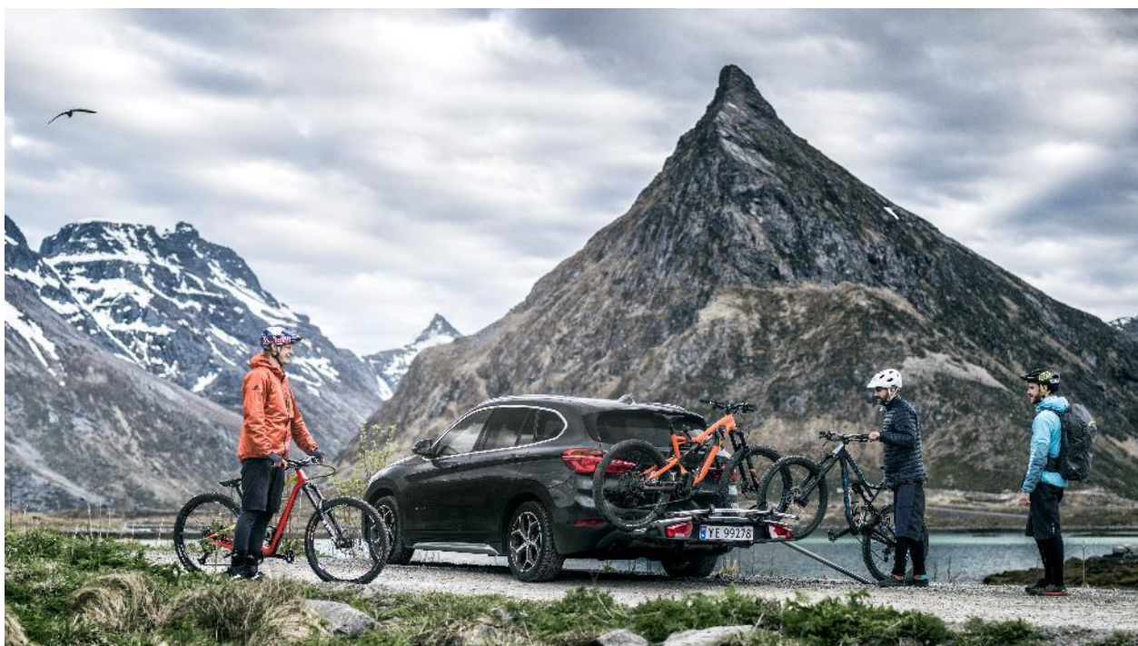
Thule VeloSpace XT – En mångsidig dragkroksmonterad cykelhållare för alla typer av cyklar, från elcyklar och fatbikes till barncyklar. Cykelhållaren kan dessutom kompletteras med Thule BackSpace XT, lastboxen som passar utmärkt för golfbagen eller barnvagnen.