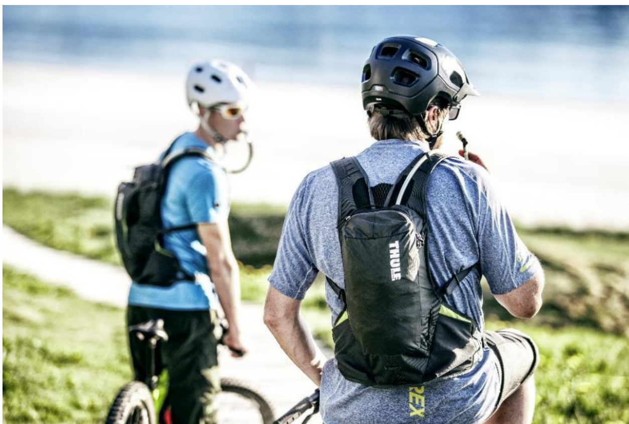
Thule Vital – en RedDot design-prisvinnande innovativ vätskeryggsäck för mountainbike-cyklister. Den smarta patenterade magnetiska ReTrakt lösningen för vätskeslangen gör att slangen kommer på plats och hålls mot axelremmen av sig själv när man druckit färdigt.