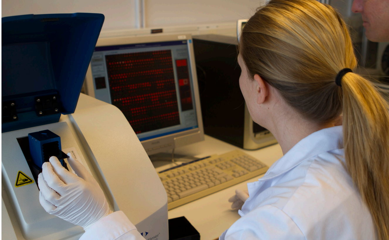
Medarbetare vid Immunovias laboratorium i Lund diagnostiserar pankreascancer med hjälp av en droppe blod på en microarray.

Pankreascancer är ett stort globalt problem med en förskräckande hög dödlighet. Endast cirka 15-20 procent av de patienter som får diagnosen kan opereras. De 80-85 procent som inte kan opereras på grund av att cancer är för långt framskriden har en medianöverlevnad på mindre än 6 månader. Om det var möjligt att upptäcka pankreascancer 6-12 månader tidigare skulle den del av patienterna som kan opereras öka dramatiskt och därmed även femårsöverlevnaden.